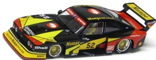
Capri Turbo Peso carrozzeria: 21,3gr.

Auto Sono ammesse solo le auto (come sotto raffigurate)