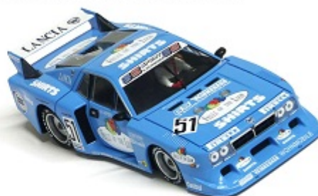
Lancia Beta Montecarlo Peso carrozzeria: 19,5gr. con interno in lexan