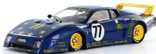
Ferrari 512 BB Peso carrozzeria: 20,3gr. con interno in lexan