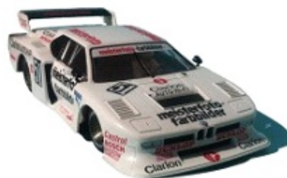
Peso carrozzeria: da 20,5gr. a 21,5gr.