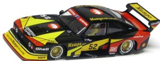
Capri Turbo Peso carrozzeria: 21,3gr.

Auto Sono ammesse solo le auto (come sotto raffigurate)