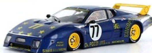
Ferrari 512 BB Peso carrozzeria: ? gr. con interno in lexan