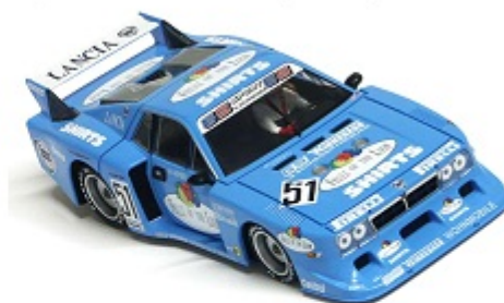
Lancia Beta Montecarlo Peso carrozzeria: 19,5gr. con interno in lexan